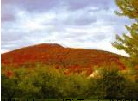
Photo de la colline de la Dix terres à Rougemont Photo de la colline de la Dix terres à Rougemont