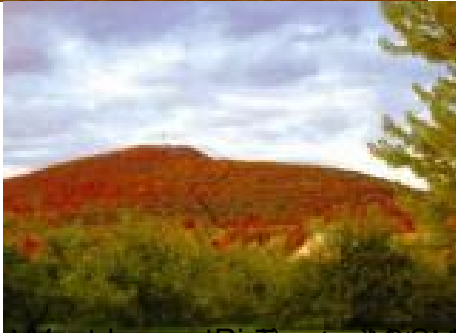
Photo de la tour de radio sur le Pic de la Dix terres à Rougemont Photo de la tour de radio sur le Pic de la Dix terres à Rougemont